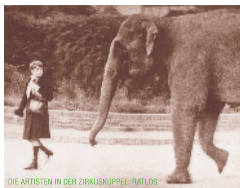
DIE ARTISTEN IN DER ZIRKUSKUPPEL: RATLOS

In der Filmgeschichte weist der Zirkusfilm eine Reihe von Besonderheiten auf: seine Langlebigkeit, seine internationale und kulturelle Verankerung in der Kinematographie und sein hohes Maß an Beweglichkeit zwischen filmischer Massenunterhaltung und großer Filmkunst. Eine weitere Eigenschaft des Zirkusfilms