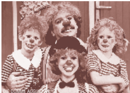
DIE DUMME AUGUSTINE