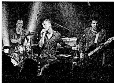
Pop-Export-Schlager aus Nürnberg: Die „Tanz-Punks“ von The Robocop Kraus.