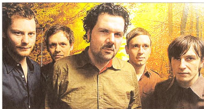
Klingt gut, auch wenn es als Faschings-Gag begann: „The Robocop Kraus“.

Dass ihr Tun eines Tages von einem Kulturreferat als förderungswürdig eingestuft würde, hätten sich die fünf jungen Herren von The Robocop Kraus sicher nicht träumen lassen, als sie im Februar 1998 ihre Band als eine Art Faschingsgag gründeten. Die Geschichte von den beiden „verfeindeten“ Schülerkombos – die eine aus der Realschule, die andere aus dem Gymnasium zu Hersbruck – die sich damals zu einem Friedensprojekt zusammaten – sollten die „Robos“ Jahre später in unzähligen Interviews erzählen.