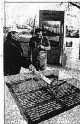
Der Grundstein des „Deutschen Stadions“ (links) wurde gestern an die Große Straße versetzt – und mit einer Info-Tafel versehen. Den gigantischen Bau (rechts) sollte NS-Architekt Albert Speer nach dem Willen von Adolf Hitler für 400 000 Menschen bauen. Doch er wurde nie begonnen.

Doch das Grusel-Geheimnis lüften auch die Tafeln nicht: Nach AZ-Informationen wurde in das Innere des Steins ein mysteriöser Stahlzylinder eingesetzt. Wie heute, war es damals schon üblich, zu Grundsteinlegungen Andenken für die Nachwelt einzumauern. Da der Bau für die NS-Führung von ungeheurer Bedeutung war – Albert Speer plante ihn nach den exakten Vorstellungen Adolf Hitlers –