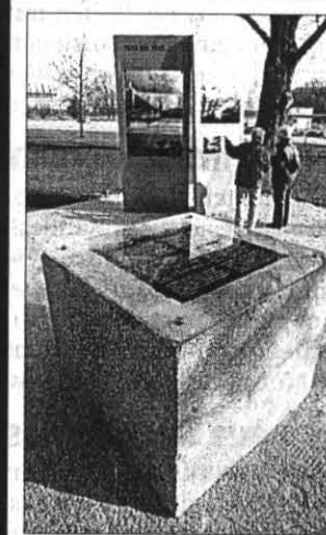
Dieser Grundstein hat ein dunkles Geheimnis.

NÜRNBERG Die Nazis planten das „Deutsche Stadion“ als größtes der Welt, doch es wurde nie gebaut. Der Grundstein, der gestern vorgestellt wurde, hat ein dunkles Geheimnis: Seite 3